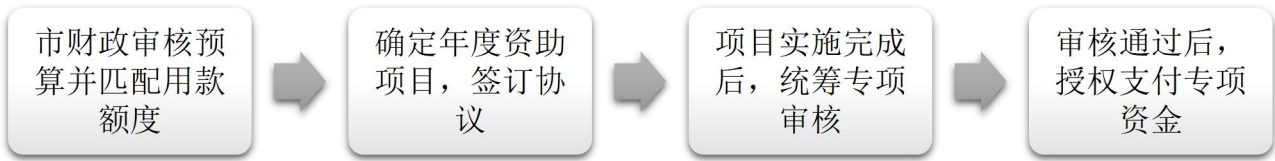
图 1 资金拨付流程图

本轮政策资金拨付均采取事后拨付方式 2 ，且均在当年完成拨付。具体拨付流程为：市财政对专项资金完成年度预算审核，下达用款额度至零余额账户。项目完成后，市政府合作交流办统筹组织审计机构进行专项审核，审核结果上报通过后，市政府合作交流办依据相关规定及《协议》约定条款，结合项目实施进度和审计机构出具的《专项审核报告》，在预算额度内支付专项资金至受资助项目实施主体账户。资金拨付流程详见图 1。